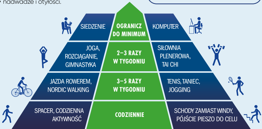
PIRAMIDA AKTYWNOŚCI FIZYCZNEJ